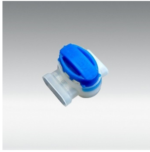
Verbindungsklemme 3M™ Scotchlok™ FB-966430082

Preis- und Modelländerungen sowie Farbabweichungen bleiben jederzeit vorbehalten. Stand: Oktober 20