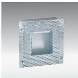
LED Plaque de scellement

LED Boîtier d'encastrement, 137 x 114 x 37 mm