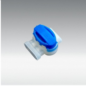
Verbindungsklemme 3M™ Scotchlok™ FB-966430082