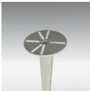
Base porteuse en aluminium Base porteuse en aluminium 500mm