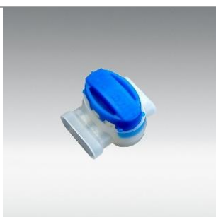
Bornes de connexion 3M™ Scotchlok™