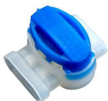
Bornes de connexion 3M™ Scotchlok™