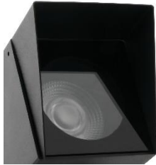
Blendschutzschirm zu Leuchte Periskop