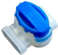
Verbindungsklemme 3M™ Scotchlok™